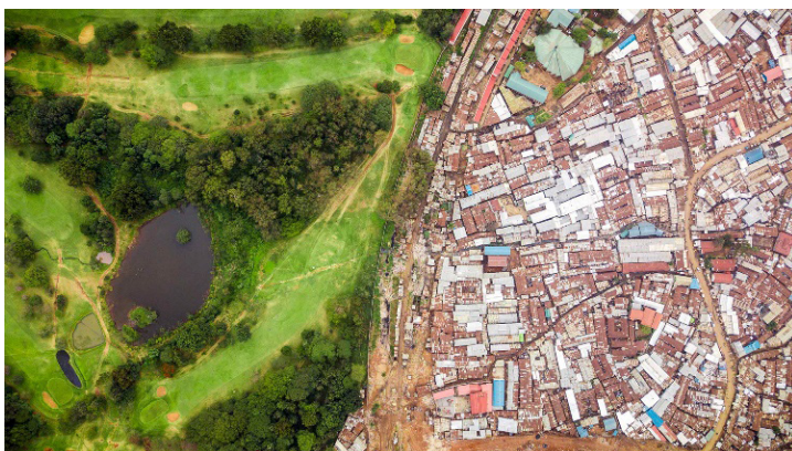
Paysage inégal, https://unequalscenes.com/nairobi